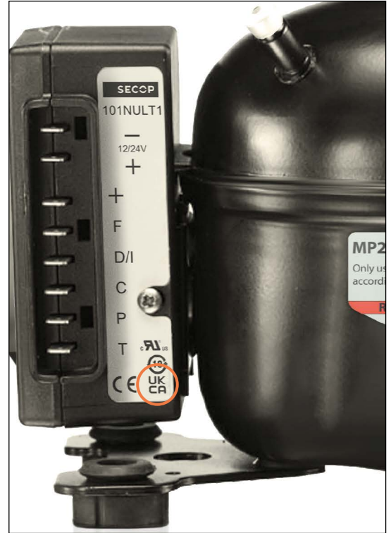
图.1 在Secop控制器标签上进行UKCA标记

Secop对其产品目录、手册以及其他印刷品中可能存在的差错不承担责任。Secop有权在不事先通知的情况下修改产品设计和规格。倘若这种修改不影响在订产品的的基本性能和规格, 则此权利也适用于在订产品。本印刷品中涉及的商标的所有权属于各相关公司。Secop及Secop标识是Secop GmbH的商标。版权所有。